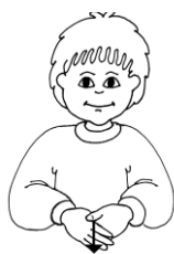
Tegnet for "ven"

Alle medarbejdere i børnehuset har kendskab til og kan anvende "Tegn til tale" – vi har erfaring for at det er et fantastisk redskab til at styrke den før-sproglige udvikling for børn med logopædiske udfordringer, men også for de yngste børn eller børn, med andet modersmål end dansk.